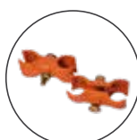
Giunti di sicurezza > vedi pag. 67-68