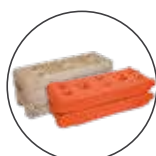
Blocchi in CLS e ABS, Ø foro 42 mm